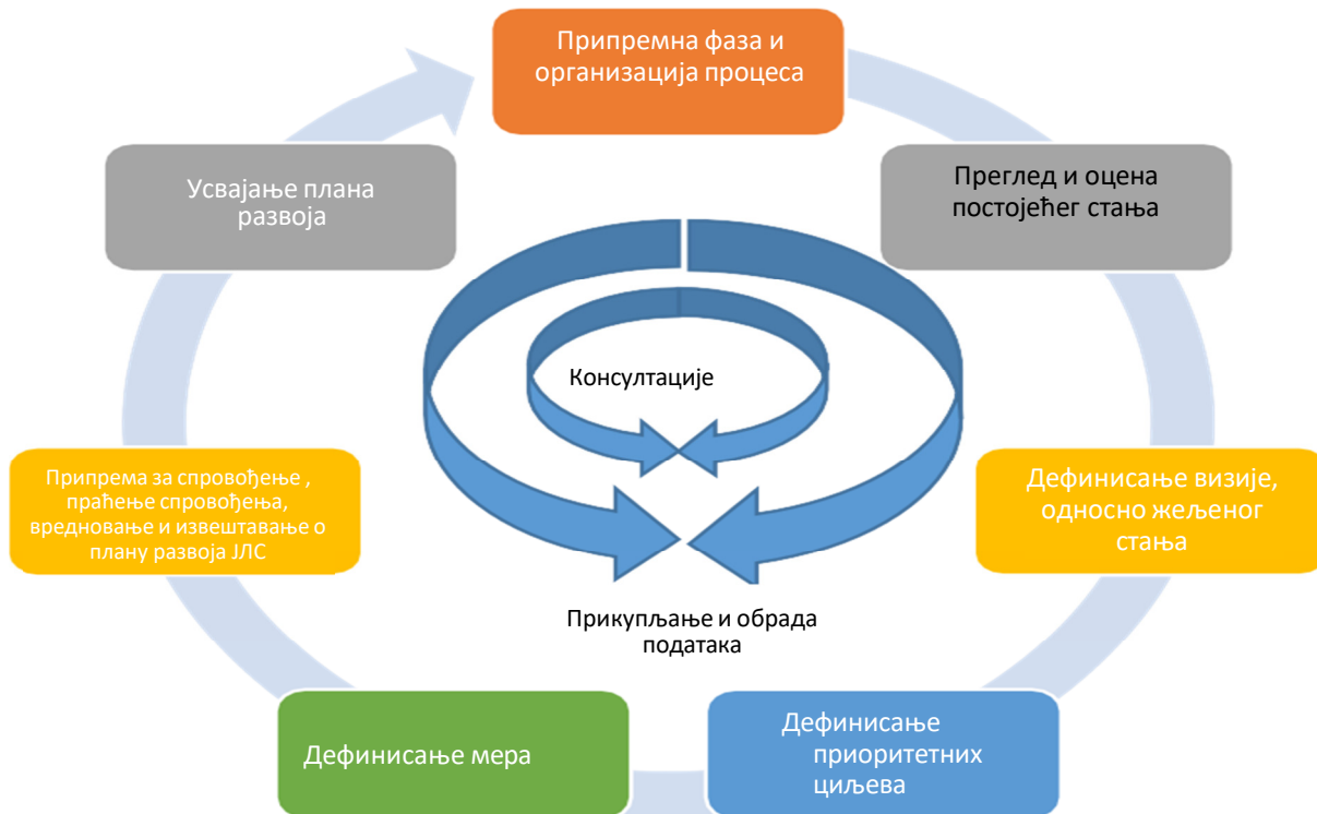
Слика 1. Фазе израде Плана развоја